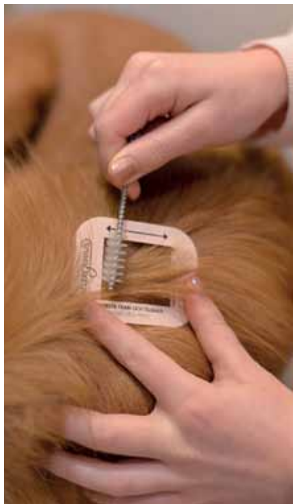
Medi-Tec lanserar nu ett test, Allergenius Dog, som mäter vilka allergiframkallande ämnen din hund utsöndrar, och i vilken mängd. Testet gör du själv hemma.

utsöndrar allergen i varierande mängd och koncentration, reagerar också allergiker olika starkt på olika allergen. Vissa tål man bättre. Kanske är det så att du träffat på en hund som du kunnat umgås med, trots att du är allergiker? Det kan vara så att den hunden då har en allergenprofil som är omvänd din. Det vill säga, det du reagerar emot finns bara i liten mängd hos hunden och vice versa.